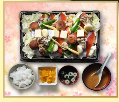
鮭チャンチャン焼き (ご飯・味噌汁・お新香付き) 一人前 1,200円(税別・写真は4人盛)