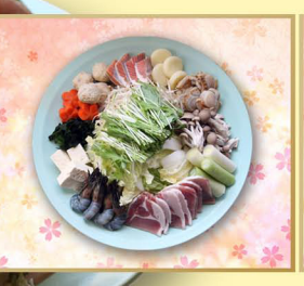
一人前 1,200円コース 税別・写真は4人盛)