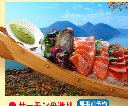
サーモン舟造り <sub>要事前予約</sub> ボリューム満点の姿造りです。